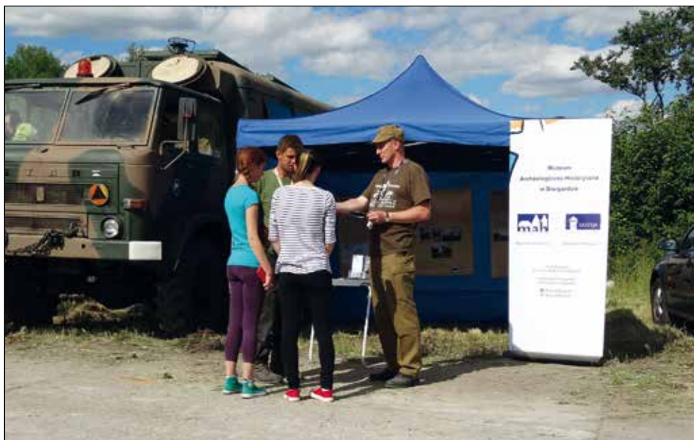
Ryc. 14. Namiot MAH w Stargardzie na zlocie militarnym „Czerwone Lotnisko” w dzielnicy Stargard – Kluczewo Lotnisko, 11 czerwca 2016 r.