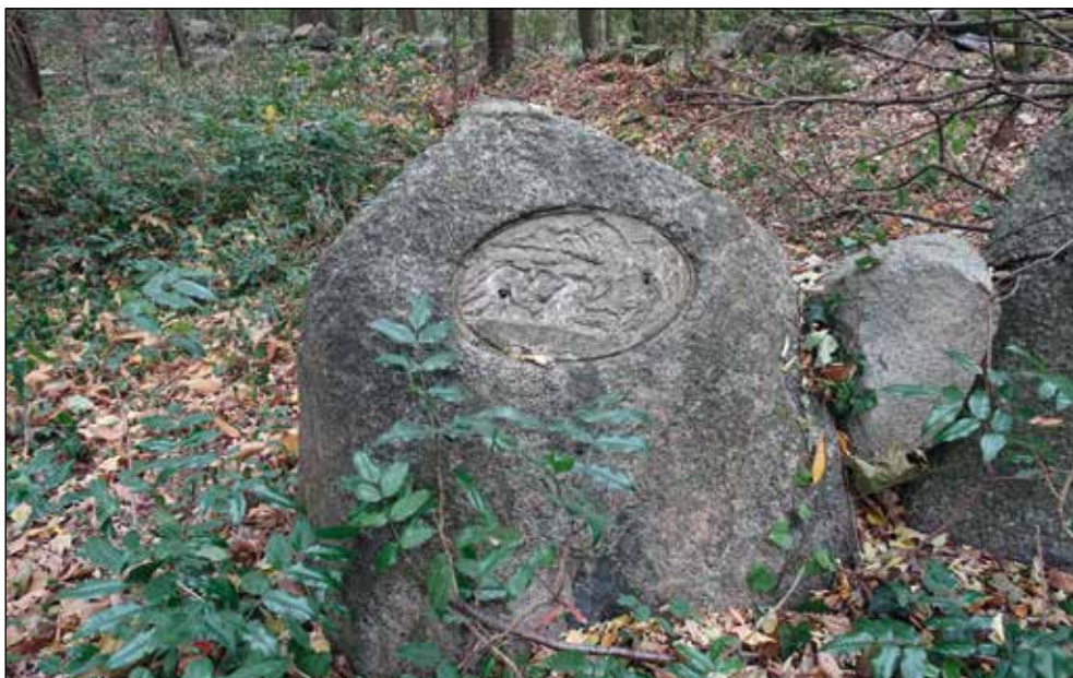
Ryc. 12. Cmentarz ewangelicki na północnym skraju wsi Bralecin (gm. Dolice, pow. stargardzki), wg stanu z 30 września 2016 r.