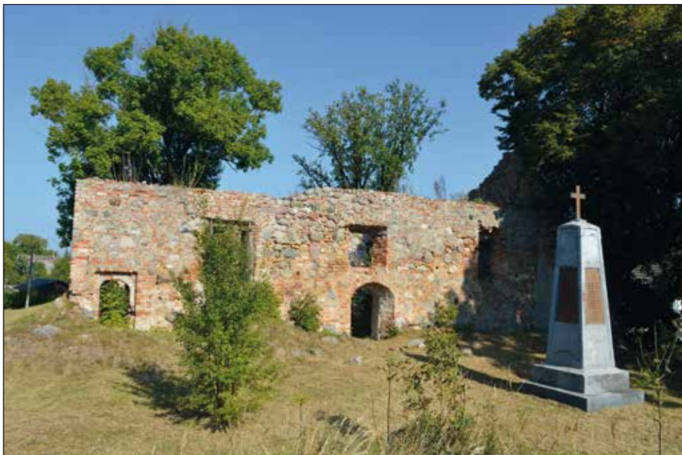
Ryc. 11. Ruiny kościoła w Szadzku oraz pomnik poświęcony mieszkańcom Szadzka poległym w I wojnie światowej, wg stanu z 27 września 2016 r.