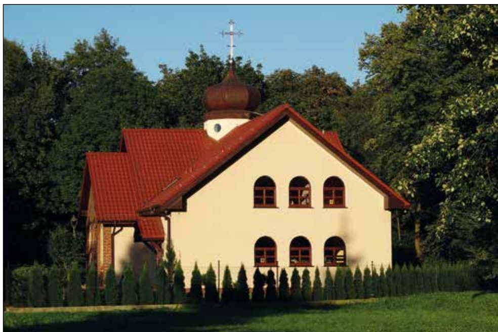
Ryc. 8. Cerkiew greckokatolicka pw. św. Jozafata Męczennika przy ul. Młyńskiej nr 36 w Stargardzie (widok od strony parku Zamkowego), wg stanu z 31 sierpnia 2016 r.