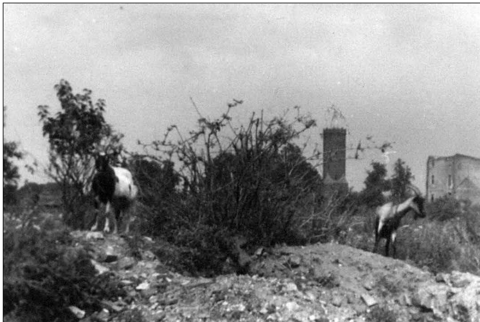
Ryc. 2. Pasące się kozy w ruinach Starego Miasta w Stargardzie, w tle widoczna Baszta Białogłówna. Fotografia zawarta w niepublikowanym albumie Juliana Adama Łukaszewskiego, Wędrowki po Polsce , Zeszyt 1, Kraków 1958. Zbiory Biblioteki Jagiellońskiej Uniwersytetu Jagiellońskiego w Krakowie