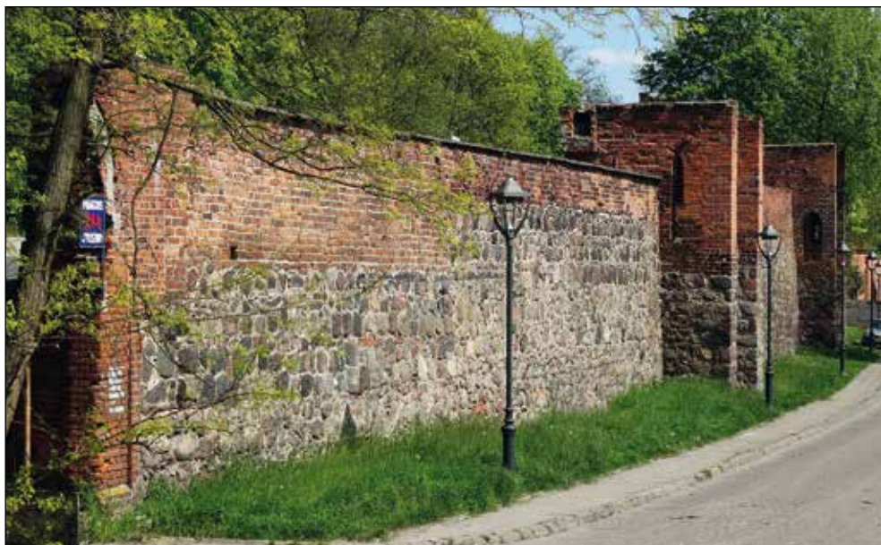
Ryc. 4. Mury obronne przy ul. Klasztornej w Stargardzie (strona miejska), wg stanu z 7 maja 2016 r.