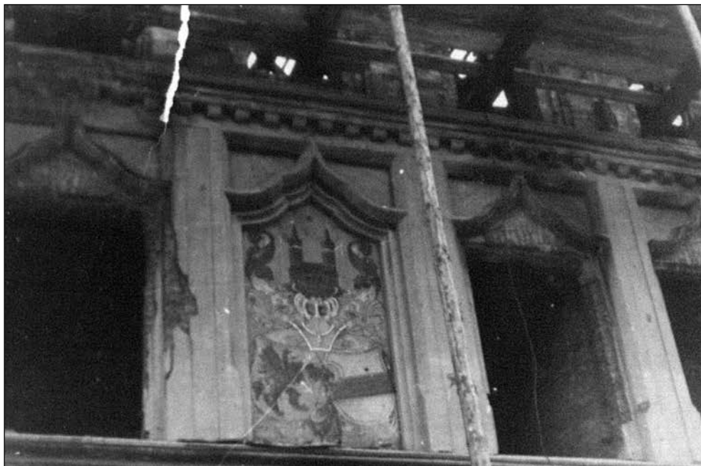
Ryc. 3. Przedwojenny herb Stargardu na fasadzie Ratusza, fotografia zawarta w niepublikowanym albumie Juliana Adama Łukaszewskiego, Wędrowki po Polsce , Zeszyt 1, Kraków 1958.