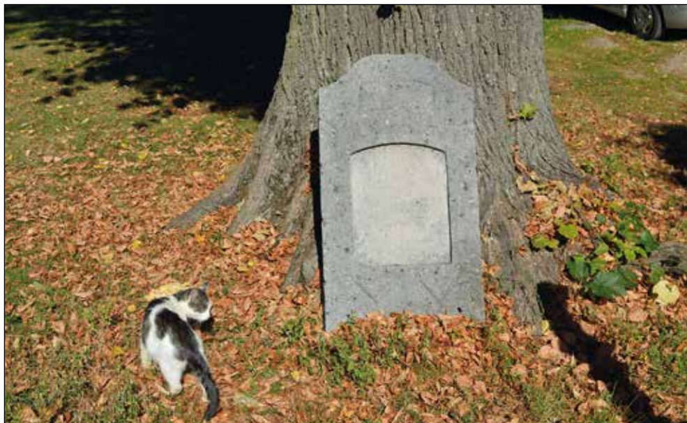
Ryc. 13. Nagrobek z dawnego przyklasztornego cmentarza ewangelickiego w Marianowie, wg stanu z 21 września 2016 r.