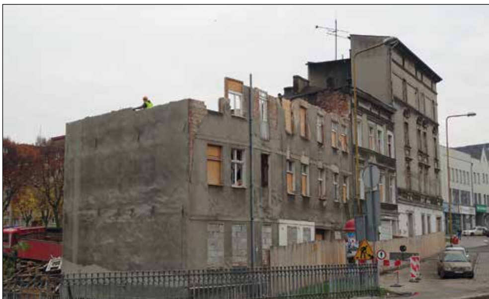
Ryc. 6. Wyburzanie kamienicy przy ul. Bolesława Chrobrego nr 16, wg stanu z 5 listopada 2016 r.