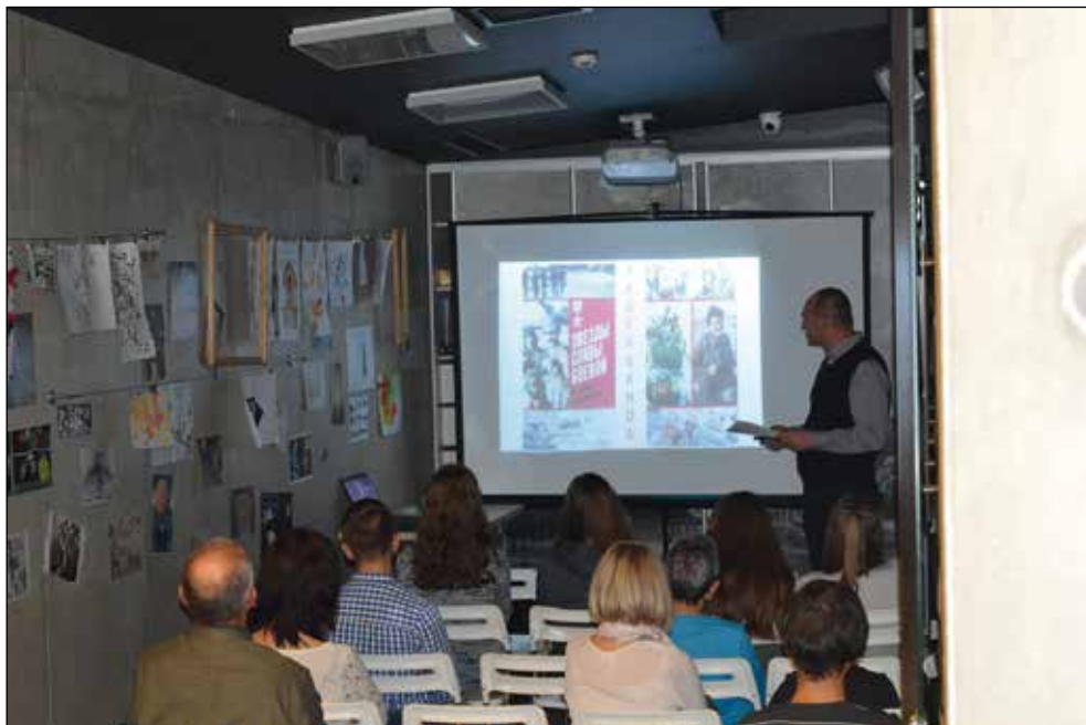
Ryc. 15. Prelekcja w Bastei pt. Radziecka interwencja w Afganistanie 1979-1989 w ramach „Muzealnych Spotkań z Przyszłością”, 27 października 2016 r.