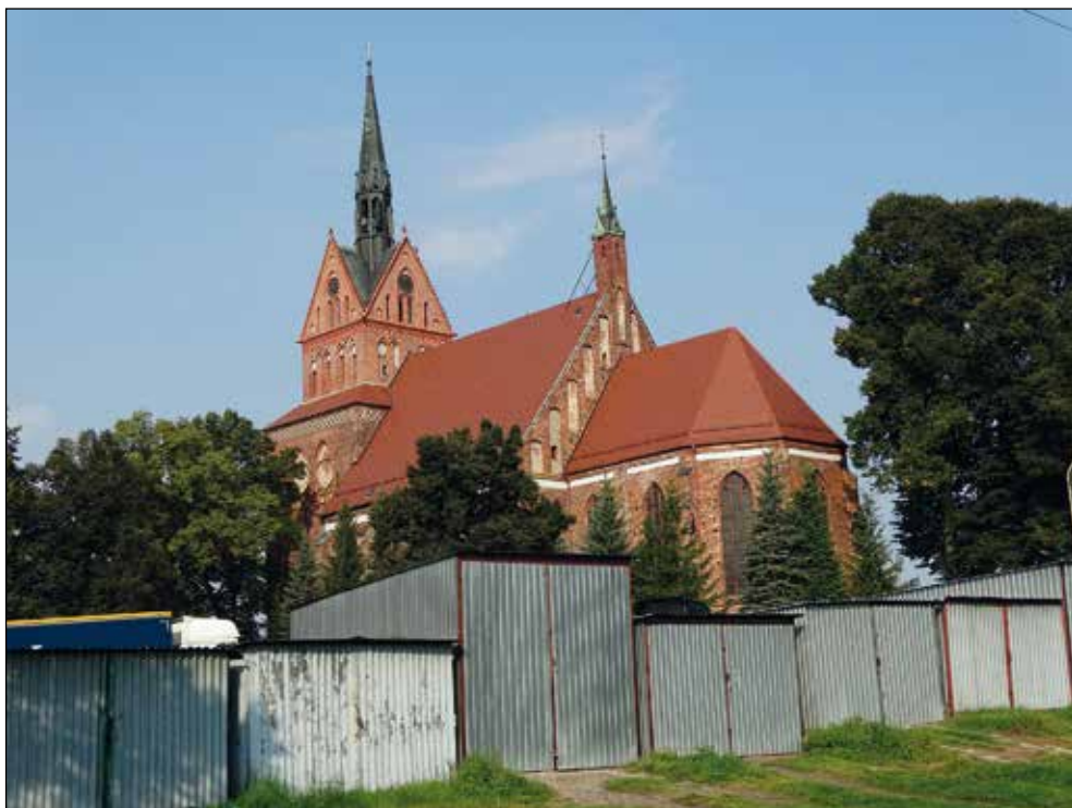
Ryc. 10. Kościół parafialny pw. Matki Boskiej Bolesnej w Chociwlu z okolo połowy XV w. (widok od strony południowo-wschodniej), wg stanu z 11 września 2016 r.