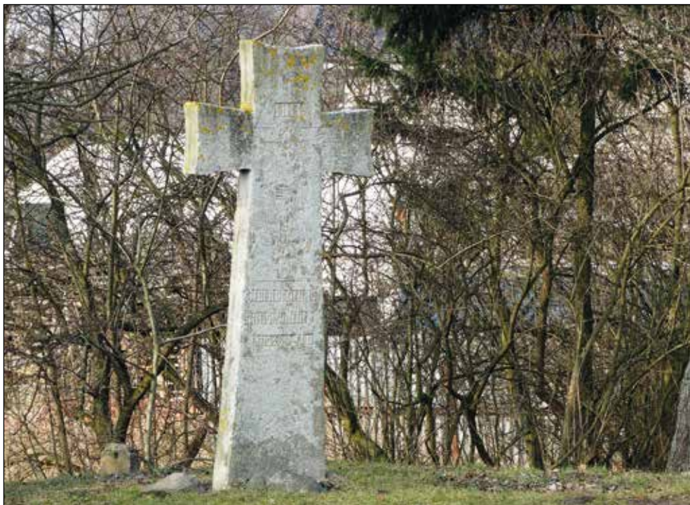
Ryc. 5. Krzyż pokutny z 1542 r. u zbiegu ulic Gdańskiej i Morskiej w Stargardzie, wg stanu z 28 lutego 2016 r.