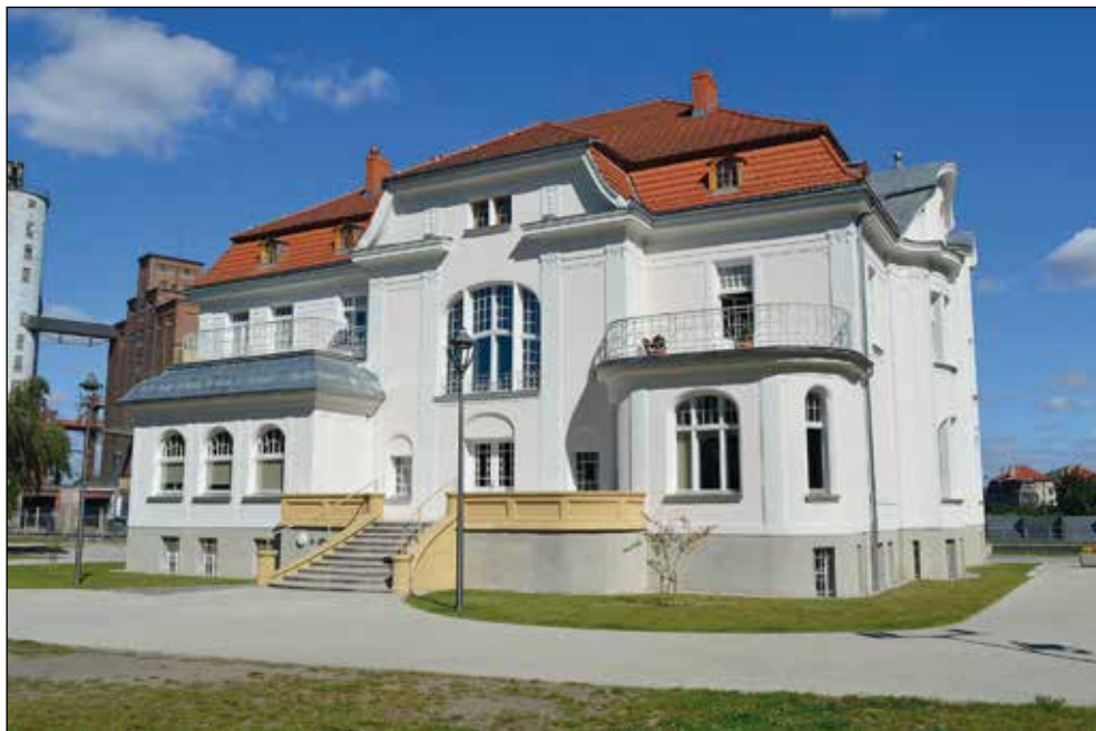
Ryc. 7. Młodzieżowy Dom Kultury w Stargardzie przy ul. Portowej nr 3 po zakończeniu prac remontowych, wg stanu z 2 września 2016 r.