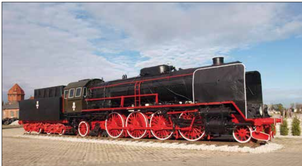
Ryc. 9. Lokomotywa parowa typu PT-47 nr 14 z 1948 r. Odremontowana w latach 2015-2016 staraniem stargardzkiej firmy „PESTA2”. Obecnie eksponowana jest na terenie dawnego ZNTK w Stargardzie, wg stanu z 31 października 2016 r.